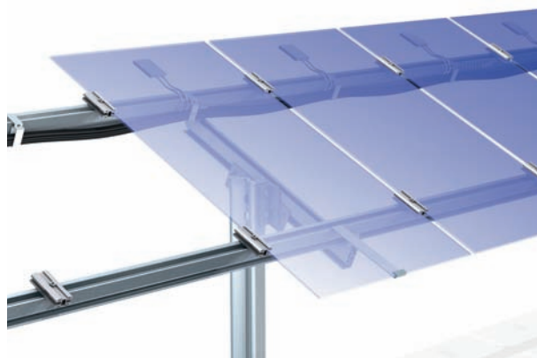
Detailní náhled - nerámované moduly